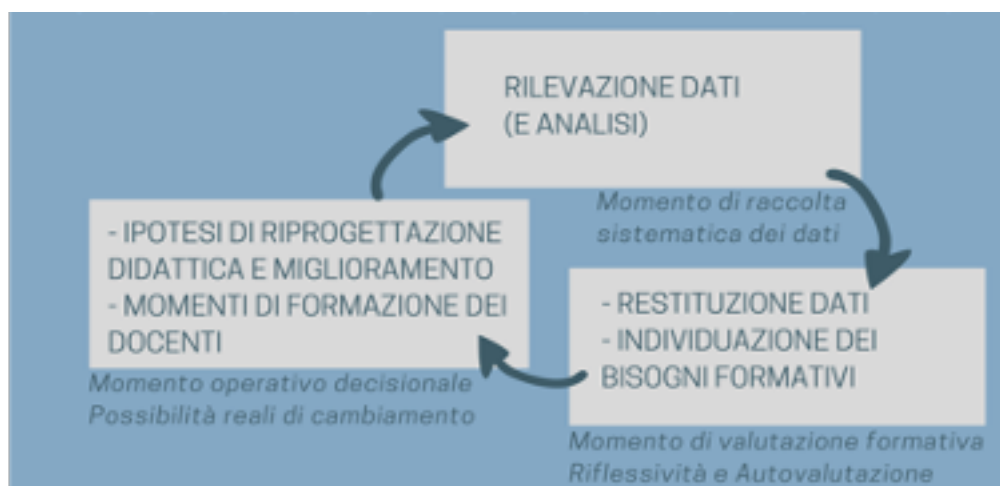
FIG.1 - APPROCCIO METODOLOGICO DI FORMATIVE EDUCATIONAL EVALUATION, RIELABORATO ED APPLICATO AGLI STUDI PILOTA NELL'ATENEO BOLOGNESE

dati e della conseguente individuazione dei bisogni formativi dei docenti universitari, momento centrale poiché focalizzato sulla condivisione e la promozione di processi di autovalutazione e riflessività; la terza fase è relativa a ipotesi di riprogettazione didattica e miglioramento: un momento operativo-decisionale in cui vengono ipotizzate collegialmente possibili azioni e direzioni di cambiamento. In questa fase sono inseriti anche specifici interventi formativi rivolti ai docenti, in risposta ai bisogni individuati (Balzaretti et al., 2018; Balzaretti & Vannini, 2018; Luppi 2018; Luppi & Benini 2017).