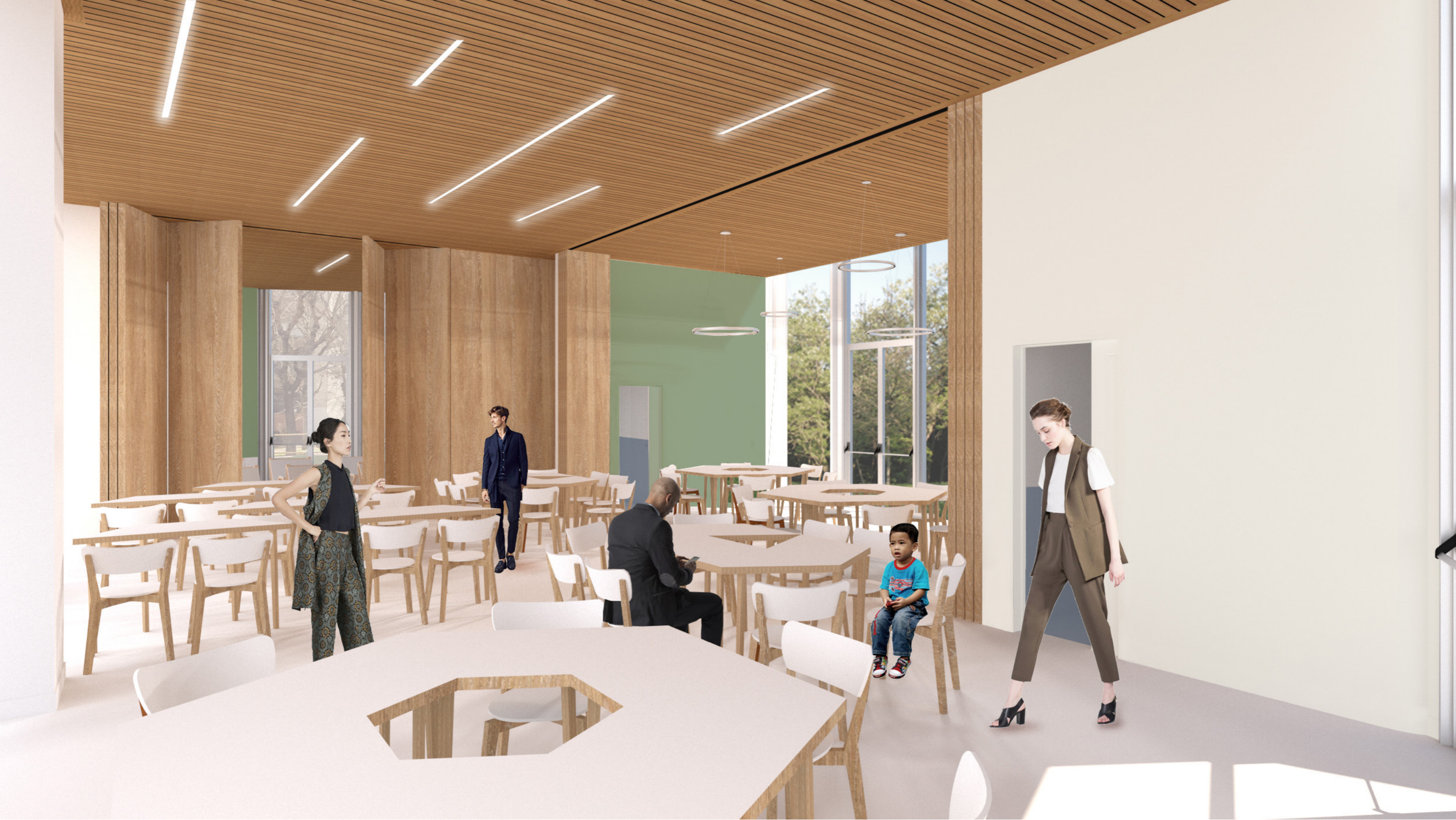
Vista B: Configurazione Aula Polivalente