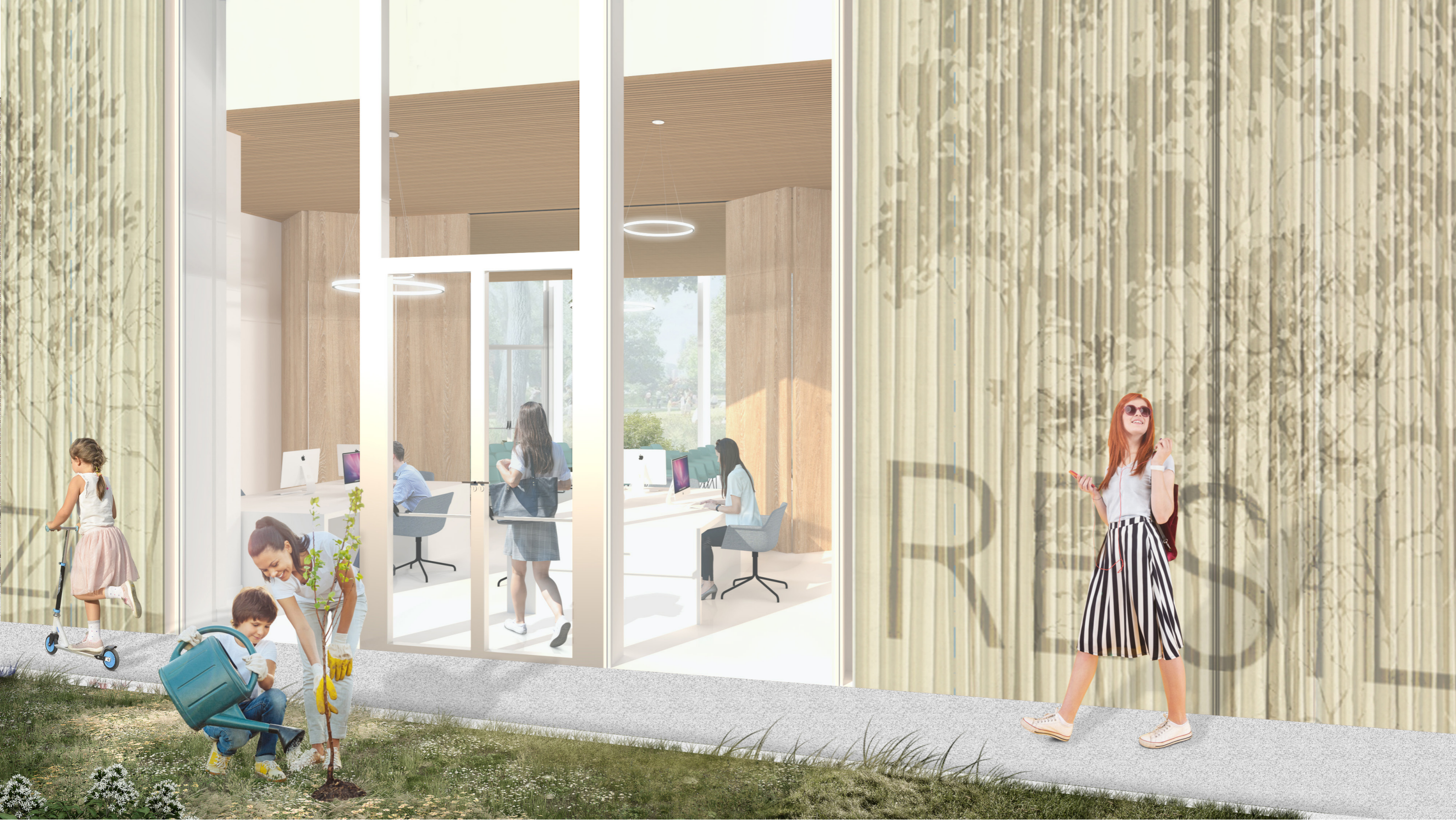
Vista dall'esterno: Dettaglio spazio uffici vista sud