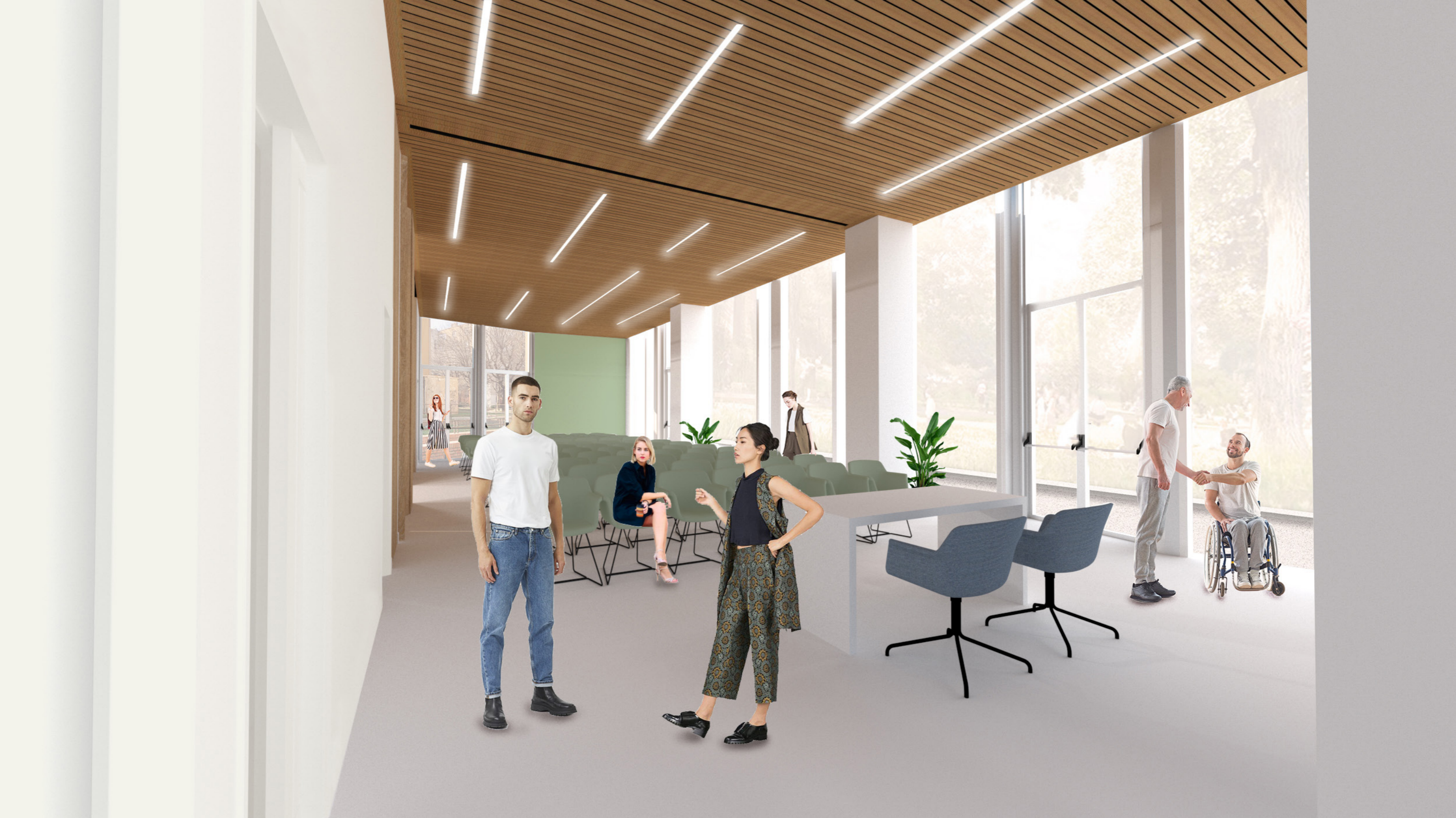
Vista C: Configurazione Auditorium