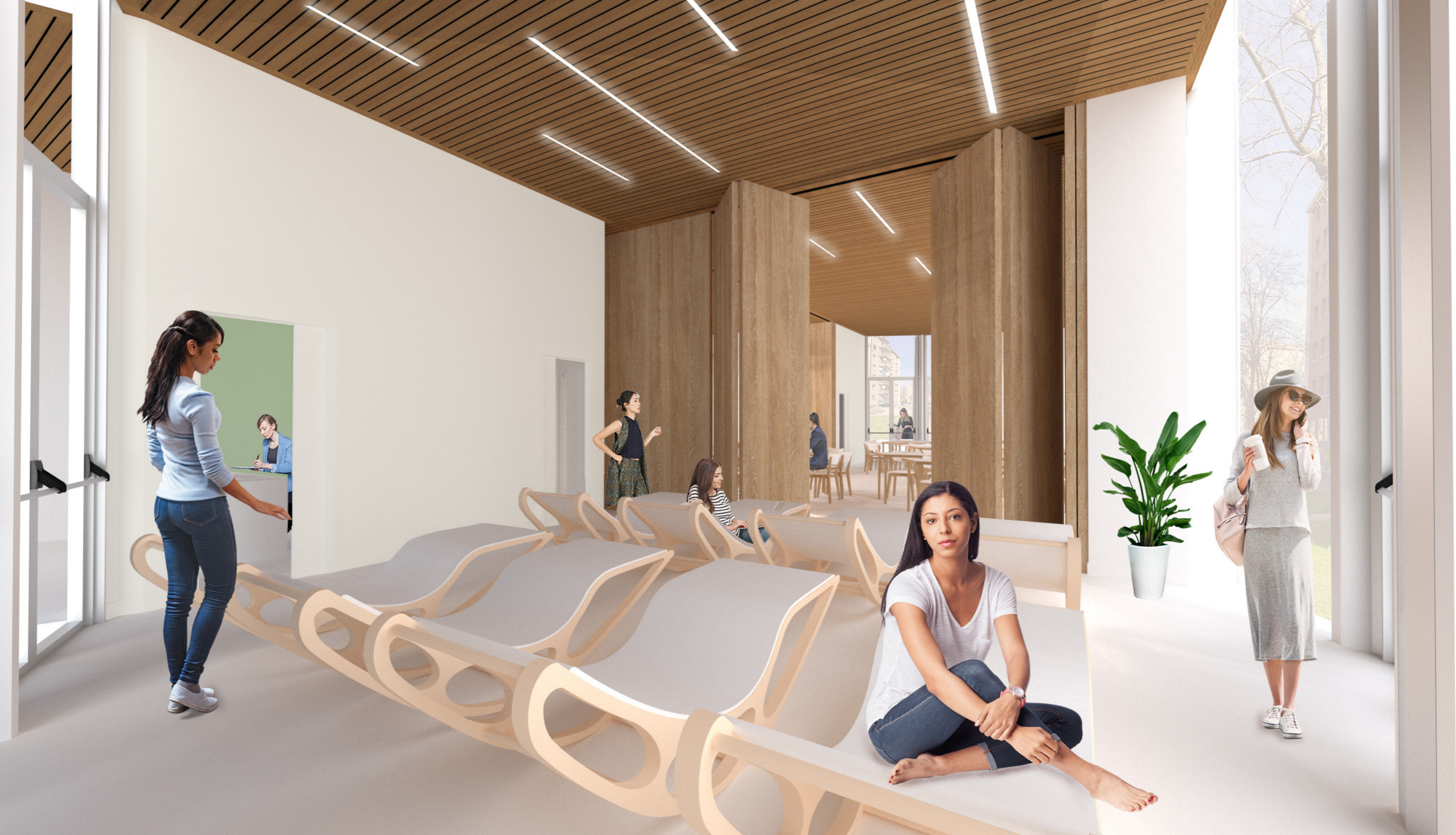
Vista D: Configurazione Aula polivalente - sala 2