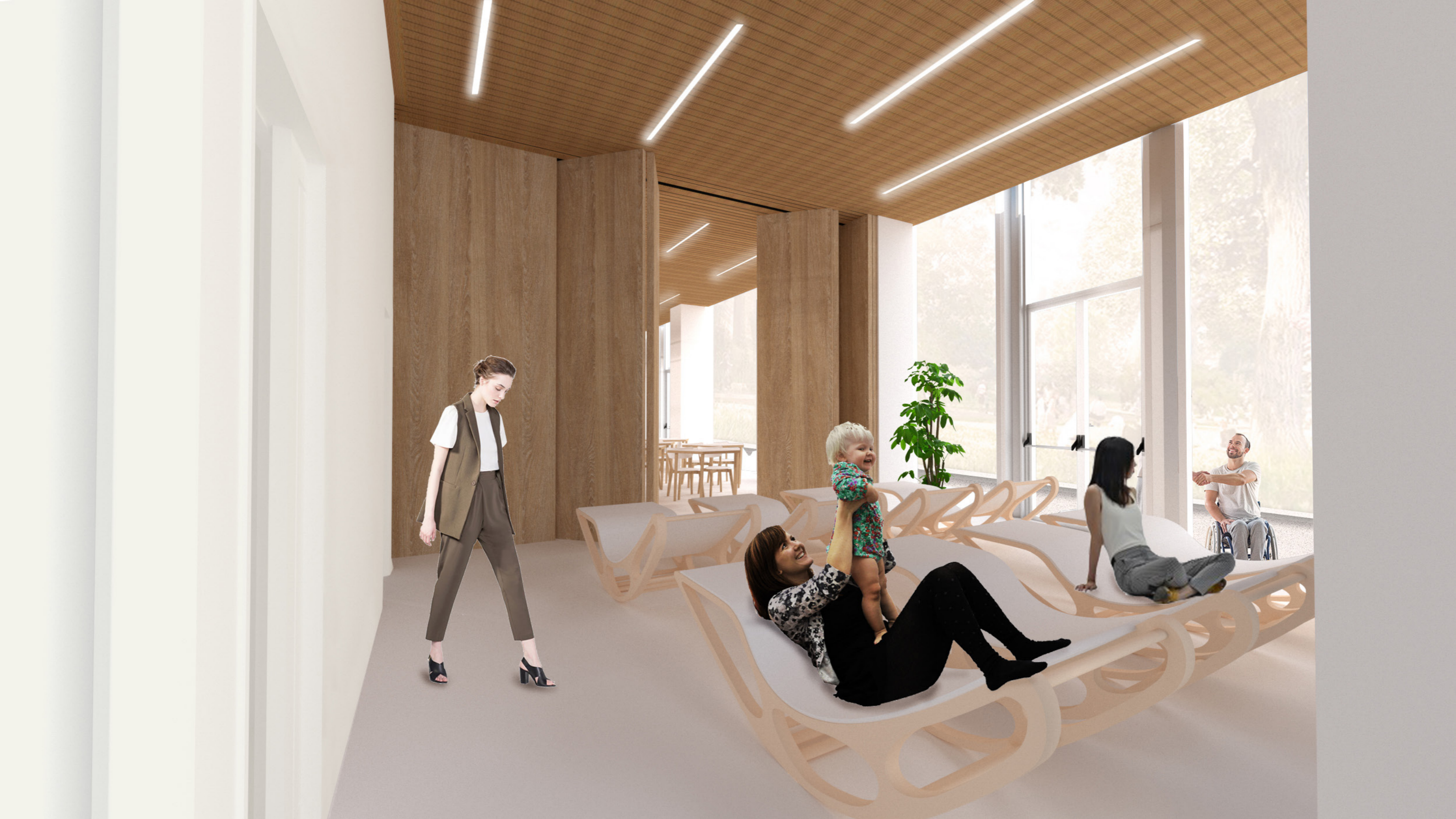
Vista C: Configurazione Aula Polivalente