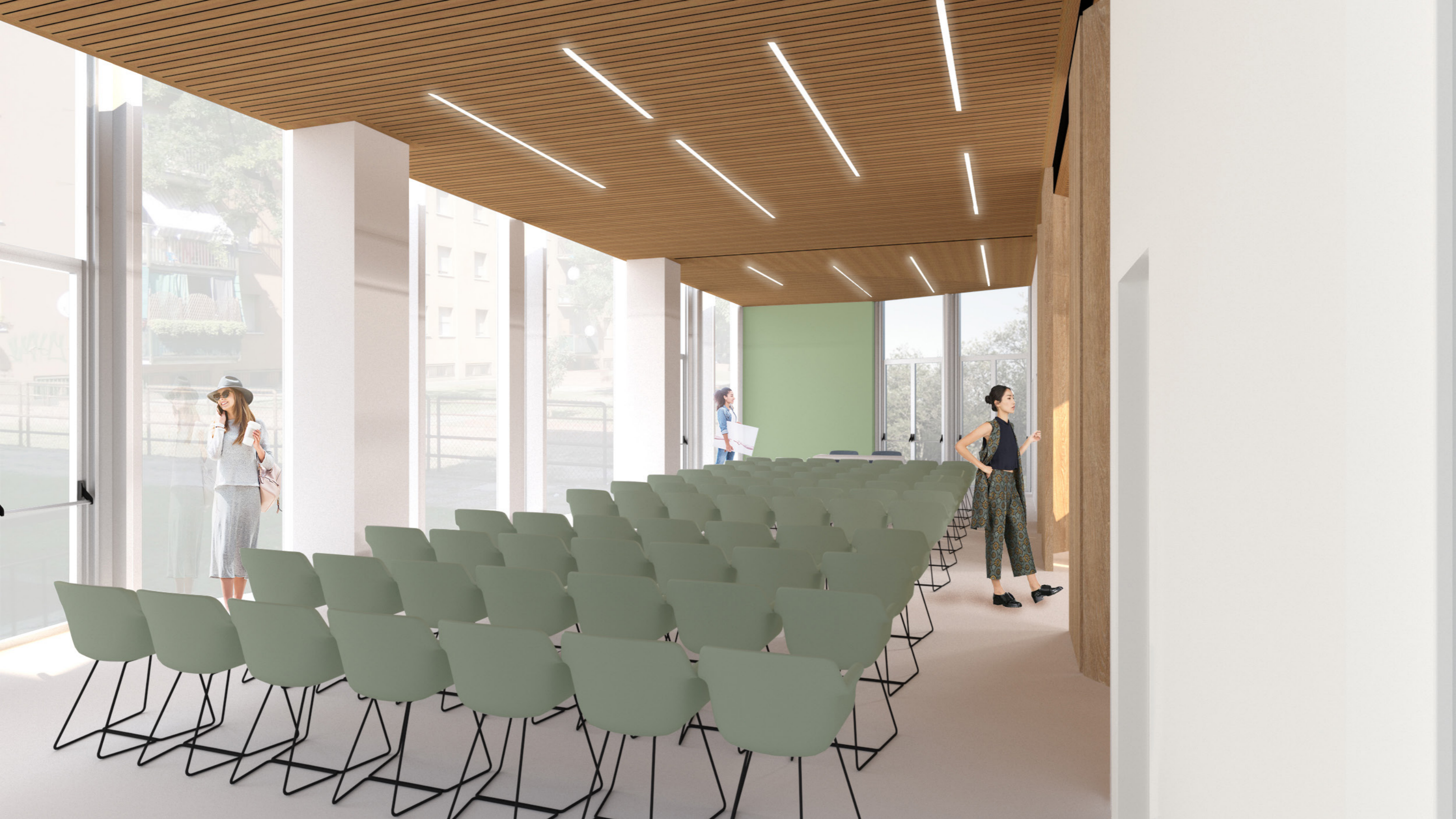
Vista A: Configurazione Auditorium PROGETTO DEFINITIVO PARCO DELLA RESILIENZA | BOLOGNA (BO)