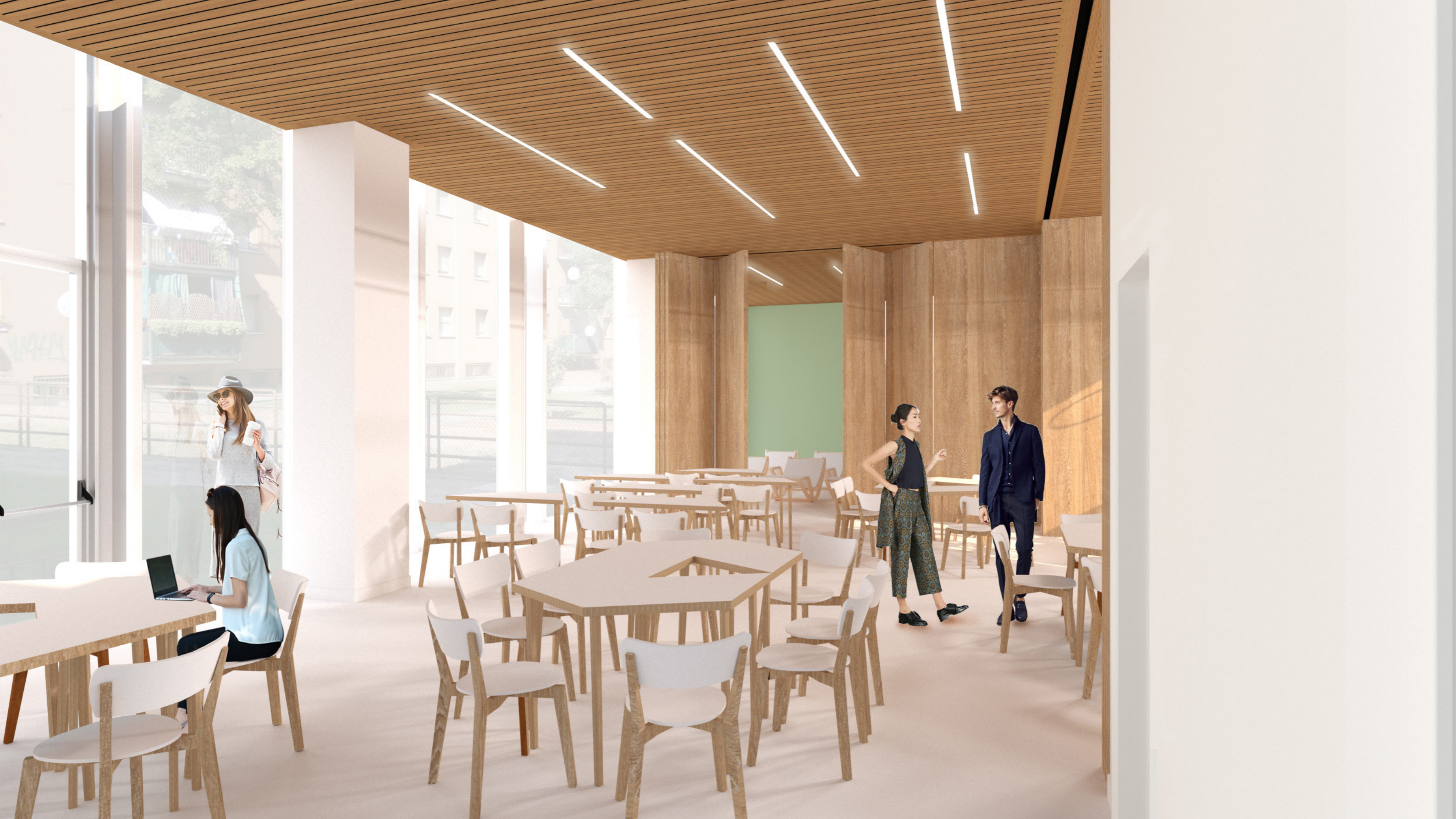
Vista A: Configurazione Aula Polivalente