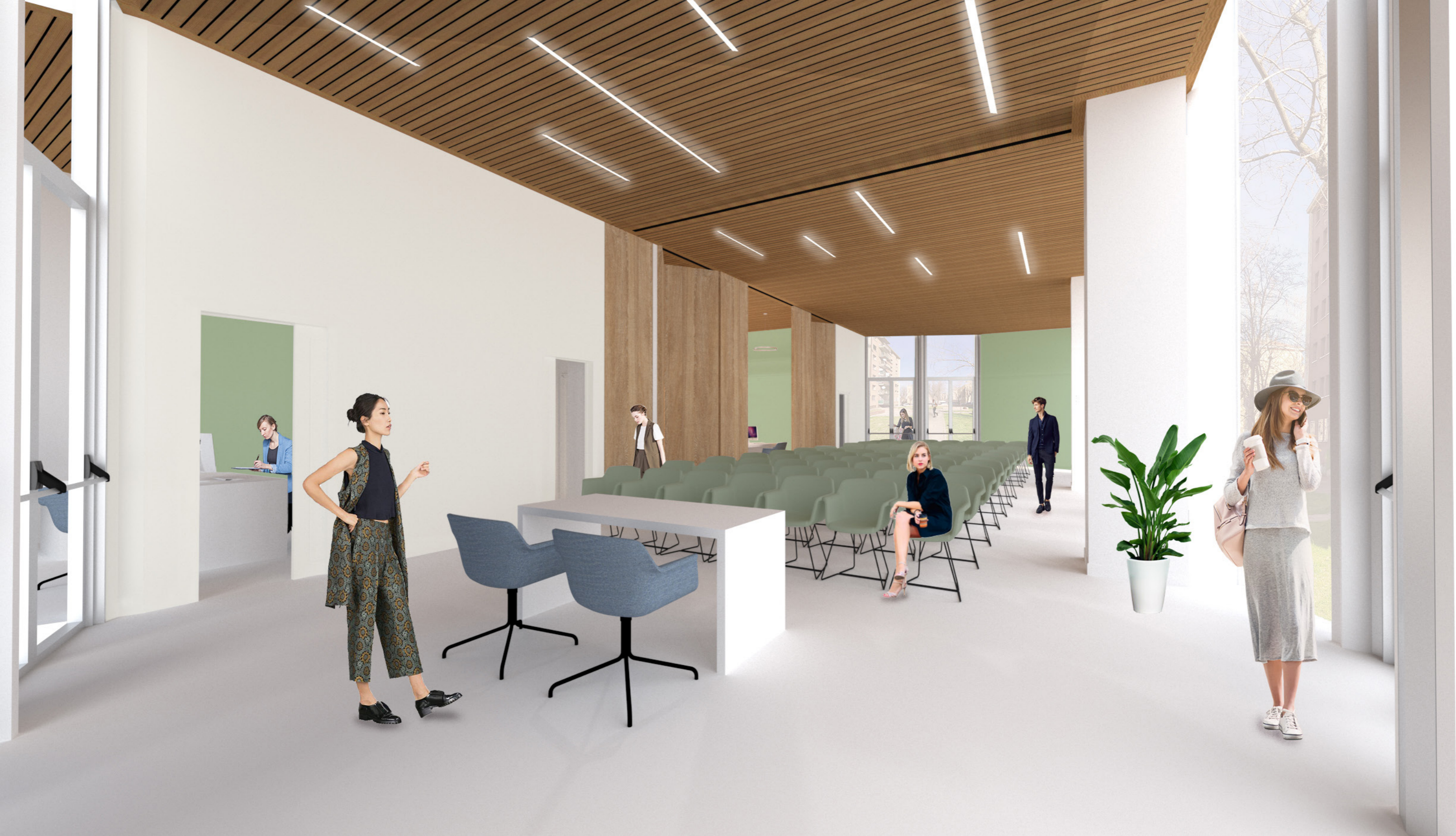
Vista D: Configurazione Auditorium - sala 1e2