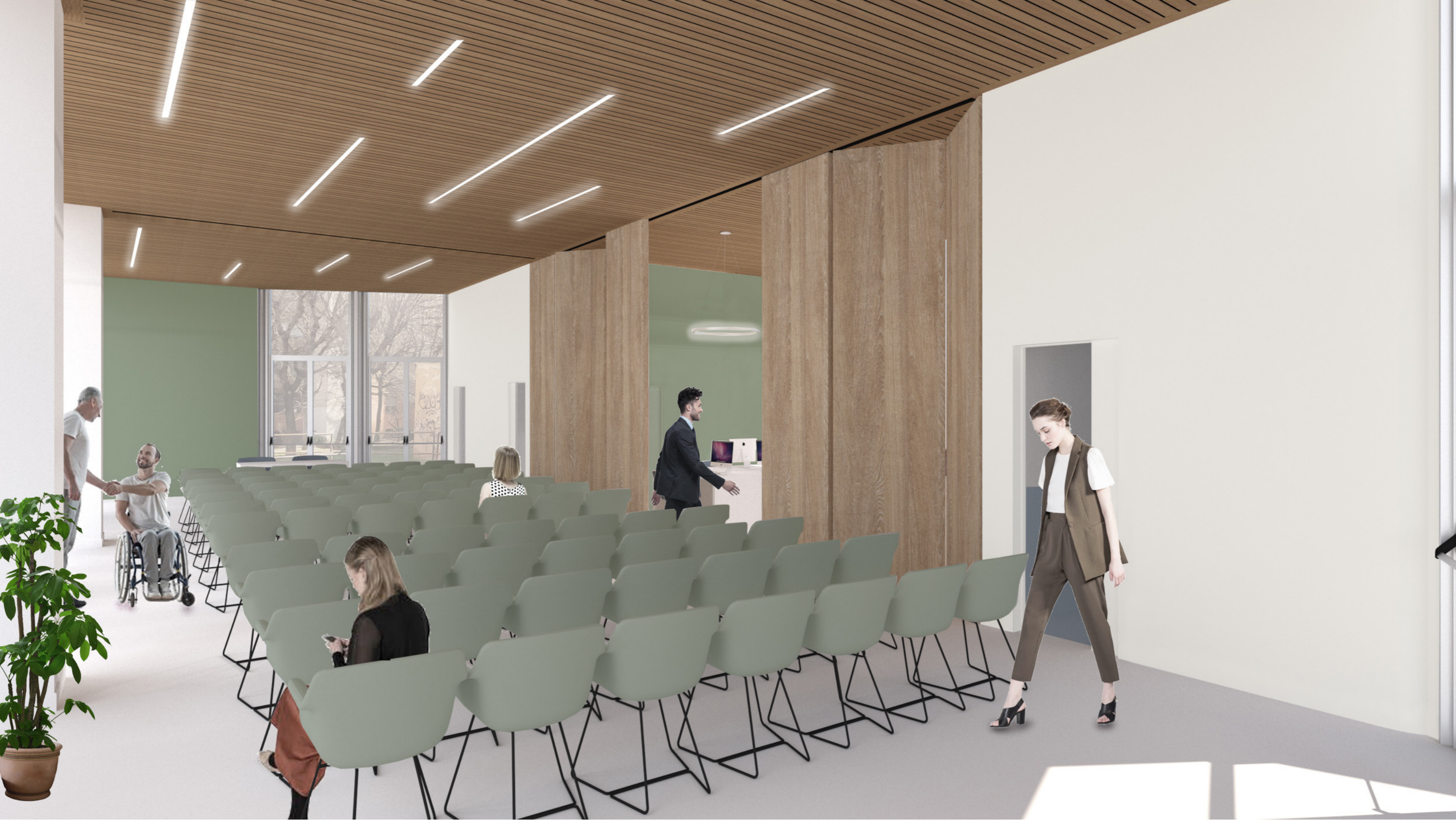
Vista B: Configurazione Auditorium