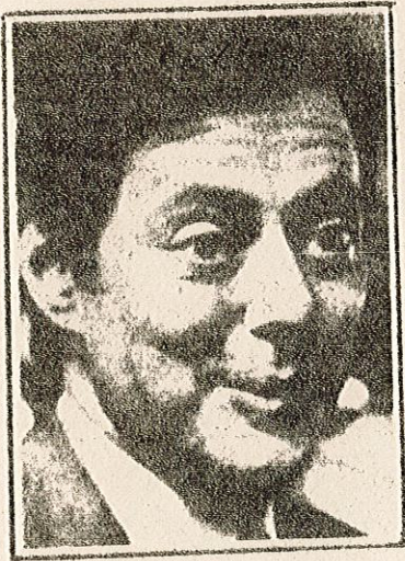
AGNELLI: Un "padrone" di destra nel parti to organico dei padroni.