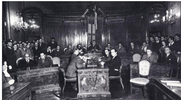
9 aprile 1946 - Insedimento del Consiglio comunale presieduto dal Sindaco Giuseppe Dozza